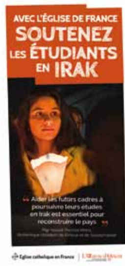
Tract (3 volets)