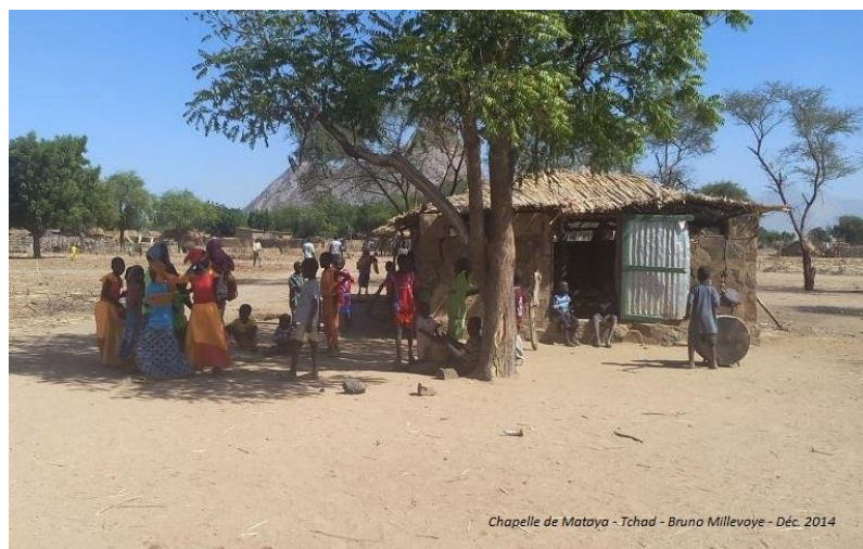
Chapelle de Mataya - Tchad - Bruno Millevoje - Déc. 2014

Afrique, la légende rose : croissance démographique et économique, richesses minières et pétrolières, marchés émergents, l'Afrique est le continent de l'avenir. Afrique, la légende noire : enfants affamés et enfants-soldats, pauvreté, guerre et corruption. En attendant le réchauffement climatique... Le défaut commun à ces deux versions, c'est qu'elle n'envisage l'Afrique que pour s'y enrichir, s'en protéger ou pour la secourir. Au choix de l'observateur cupide, peureux ou charitable. Les populations africaines ont disparu. Leurs intérêts, projets, rêves, les spécificités de chaque pays, les aspirations des jeunes du continent... il n'en est plus question.